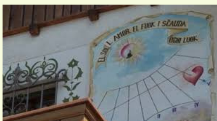
Le Meridiane di Alleghe