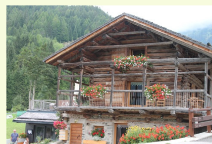
“L’Ariet” di Vallada