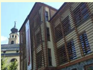
Museo Papa Luciani